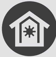
I.T.E. / PSE